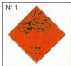
TARGA ROMBOIDALE DI PERICOLO