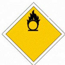
COMBURENTE O PEROSSIDO