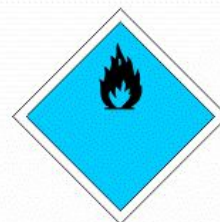
PRODOTTO CHE EMANA GAS INFIAMMABILI A CONTATTO CON L'ACQUA