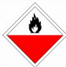
PRODOTTO AUTO- INFIAMMABILE