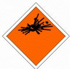
PERICOLO DI ESPLOSIONE